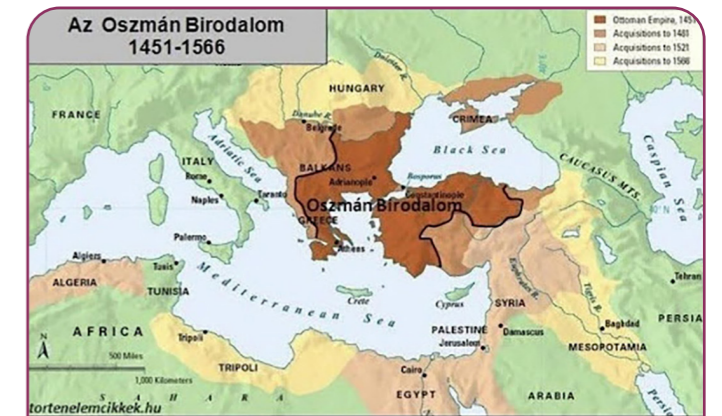
A birodalom kiterjedése Szulejmán uralkodása alatt

Ne felejtjük el II. Lajos magyar és cseh király is volt egyben. Több ezer cseh és lengyel adta az életét itt, köztük sok nemes is. Hogy miért mondtam azt, hogy mohácsi csata újra értelmezése folyik. Azoknak a kutatóknak történészeknek véleményére alapozom, akik az elmúlt időkben behatóbban tanulmányozták ezt a kort.